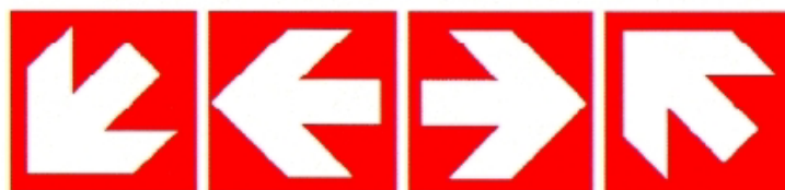
Směrovka (dolů, vlevo, vpravo nahoru) k zařízení požární ochrany (lze použít s dodatkovou tabulkou)